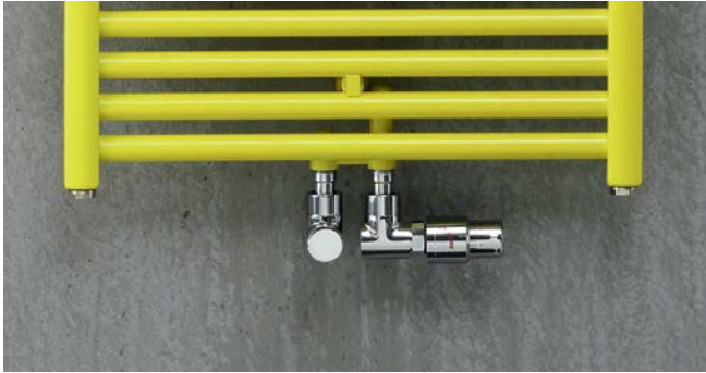
Ausführung Warmwasserbetrieb mit Zehnder Thermostat und Zehnder Komfort-Armatur in Chrom.