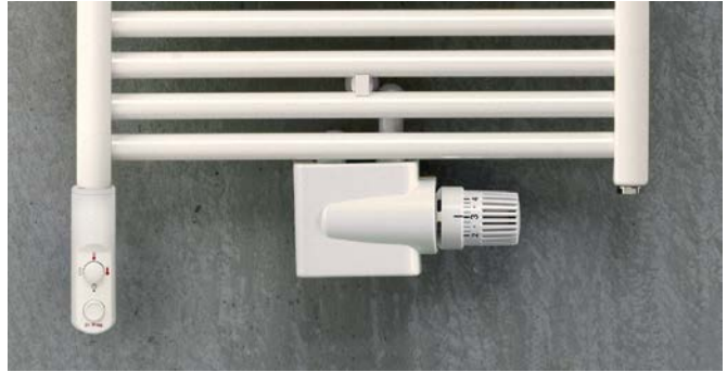
Ausführung Mixbetrieb mit Anschluss-Armatur Zehnder Vario.

V20210601, RAD_DAS, DE_de, Änderungen vorbehalten