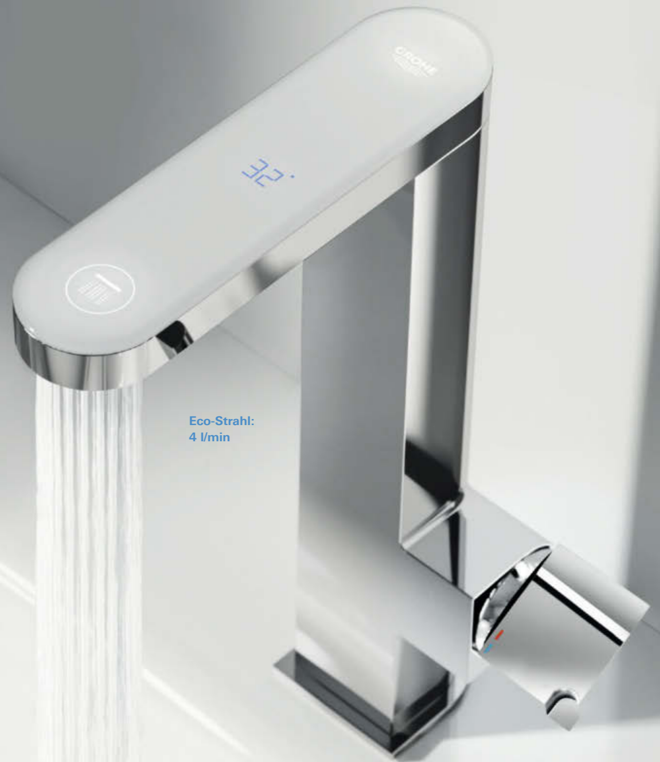
Eco-Strahl: 4 l/min