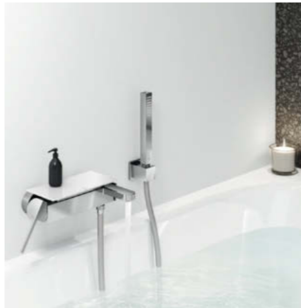
33 547 003* + 40 954 000* Einhand-Wannenbatterie mit Brausegarnitur + Duscablage