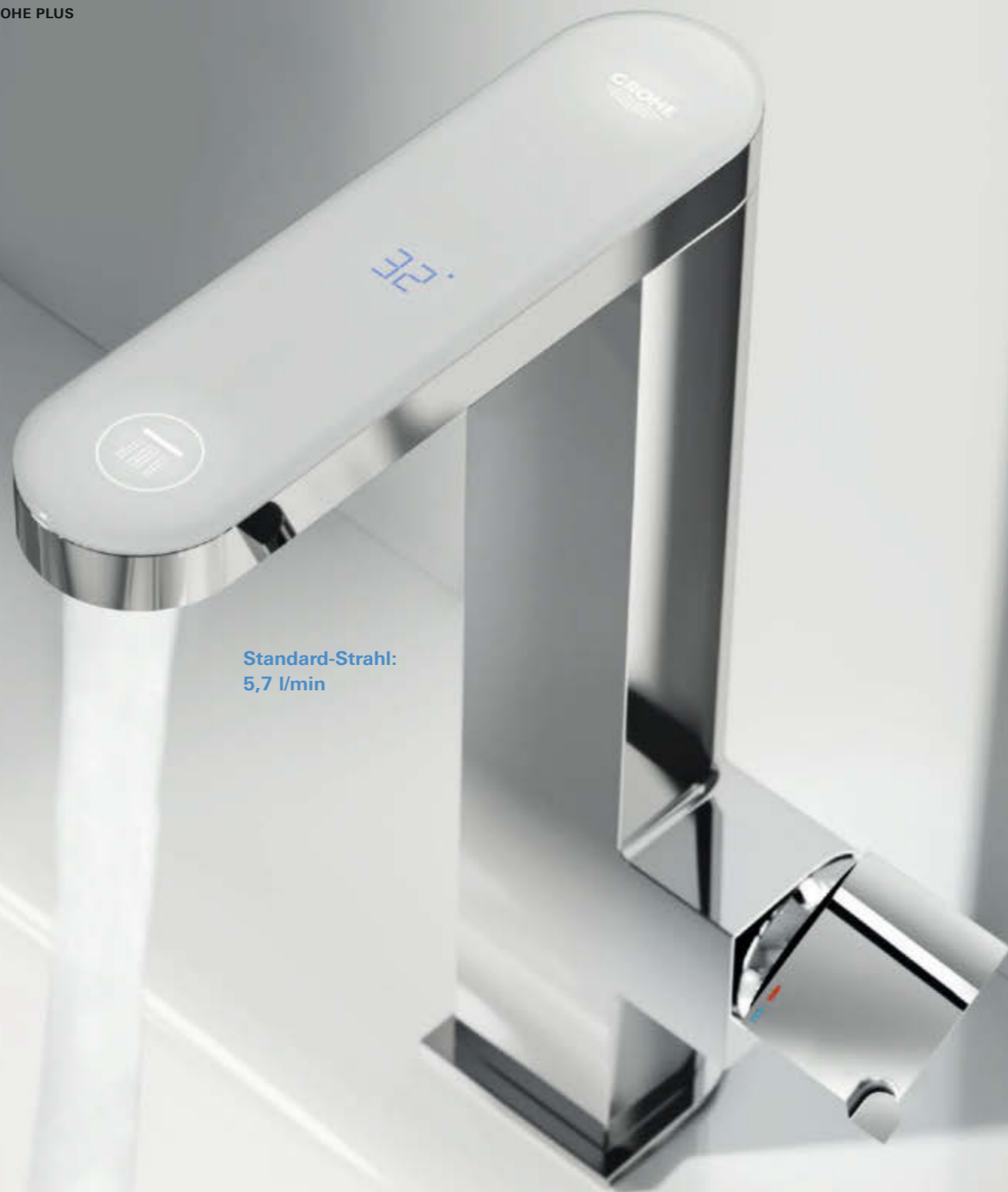
Standard-Strahl: 5,7 l/min