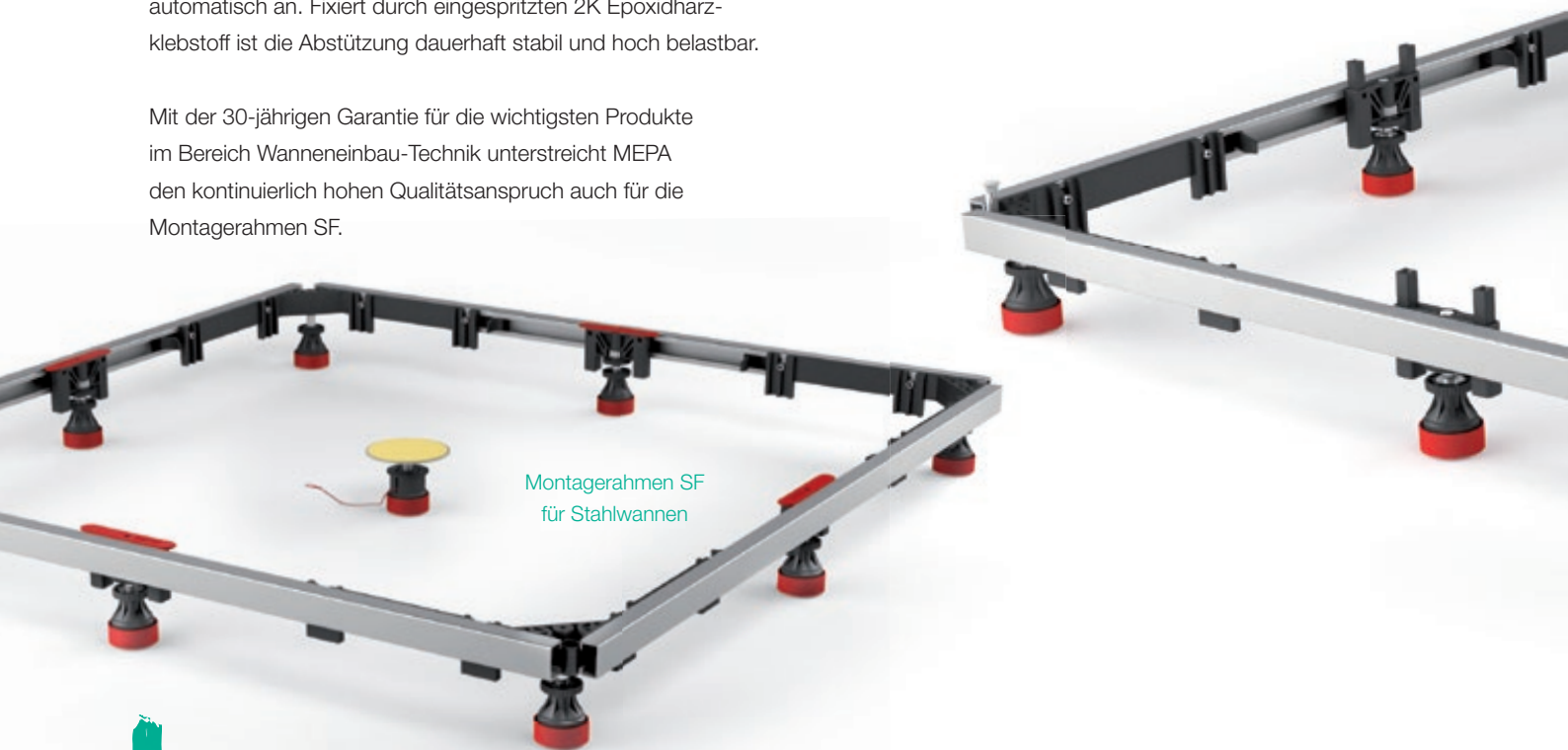
Montagerahmen SF für Stahlwannen