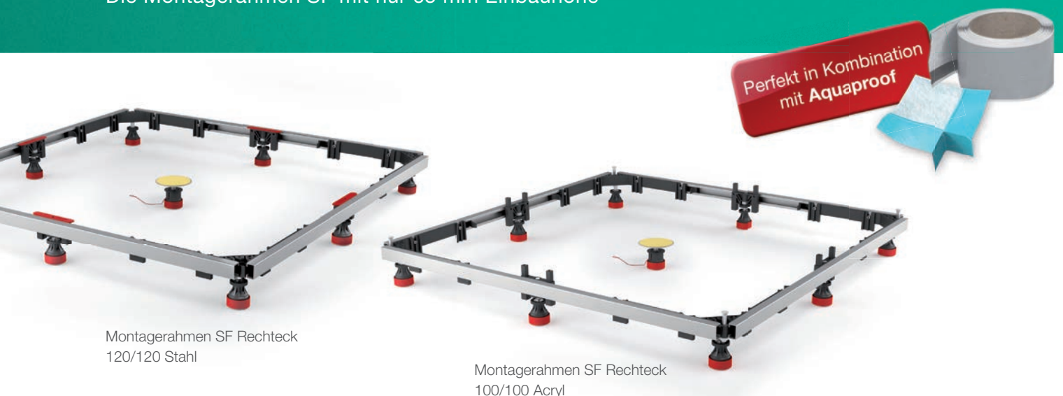
Montagerahmen SF Rechteck 120/120 Stahl

Die Montagerahmen SF mit nur 65 mm Einbauhöhe