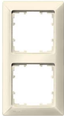
DELTA line elektroweiß Rahmen 2-fach, 151x80mm