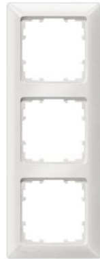
DELTA line titanweiß Rahmen 3-fach, 222x80mm