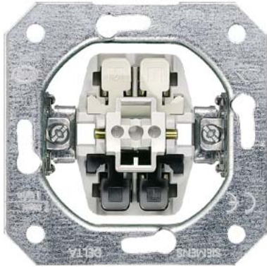
DELTA Geräteinsatz UP Aus-/Wechsel 10A 250V