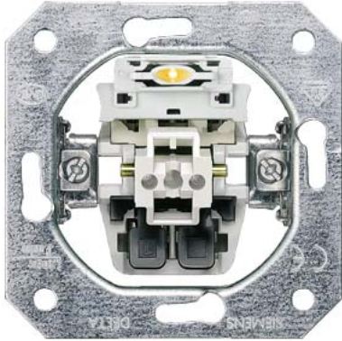
DELTA Kontrollschaltereinsatz für Ausschaltung 10A 250V