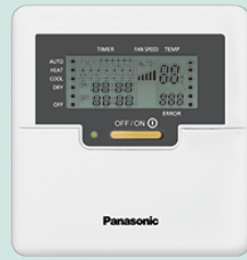
Wired Remote Control CZ-RD514C