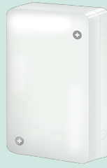
CZ-CAPRA1 RAC interface adapter for integration into P Link