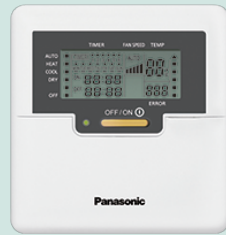
Wired Remote Control CZ-RD514C