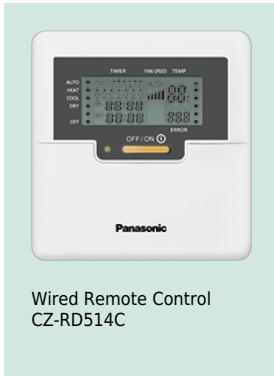
Wired Remote Control CZ-RD514C