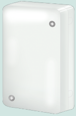
CZ-CAPRA1 RAC interface adapter for integration into P Link