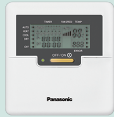
Wired Remote Control CZ-RD514C