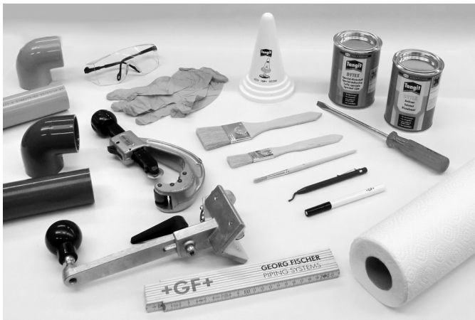
Hilfsmittel zum Kleben