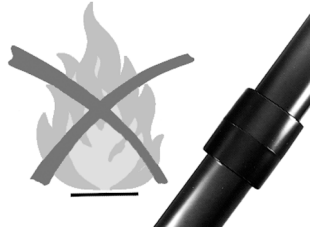
Kein offenes Feuer beim Kleben! Nicht rauchen!